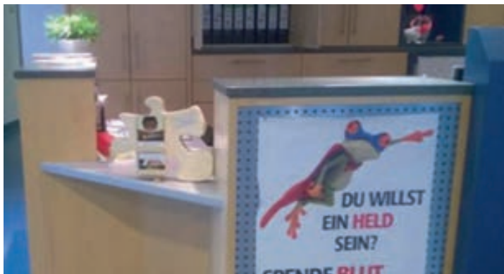
Spenden/Flyerbox im Blutspendezentrum

Das letzte Jahr haben wir in bekannter Tradition, mit dem Glühweinstand vor der Mensa, ausklingen lassen. Direkt in der Maiwoche gab es dann eine grandiose Party zusammen mit AEGEE im Sonnendeck. Unseren Infostand konnte man in diesem Jahr auch wieder an zahlreichen Orten auffinden. Seien es nun die vom AStA organisierten Veranstaltungen, Inflohmarkt und Fairytale Festival, oder der Afrikamarkt gewesen.