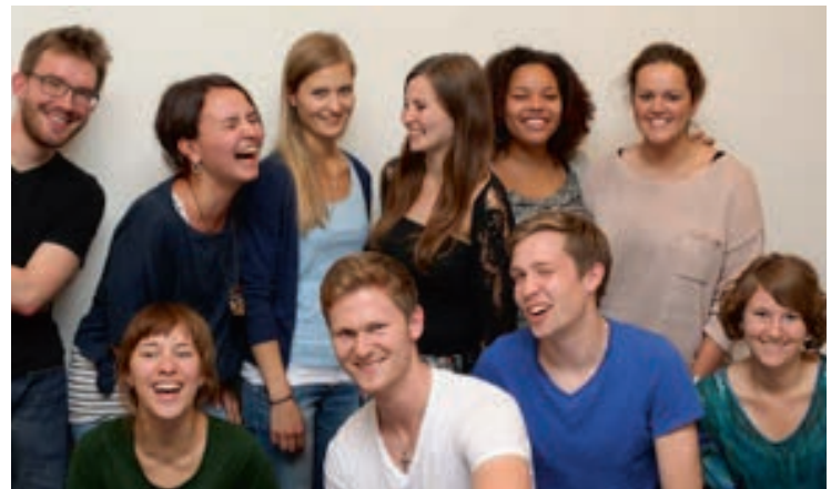
„Alt“ und „Neu“ – der Vorstand glücklich vereint

Kurz vor der Sommerpause stand wieder einmal die Vorstandswahl an. Einige der neuen Gesichter übernahmen dabei sofort engagiert die Vertretungsposten ein, da uns ein Teil auf Grund von Auslandssemestern verlassen musste. Der alte Vorstand kann nun die Leute anhand des Vorstandshandbuches längerfristig einarbeiten. Außerdem erreichte uns zeitgleich die freudige Nachricht aus Berlin, dass das Projekt in Rio de Janeiro ( Tô Ligado ) wieder angelaufen ist. Wir sind sehr erfreut, wie gut es mit dem Hockeyteam vorangeht.