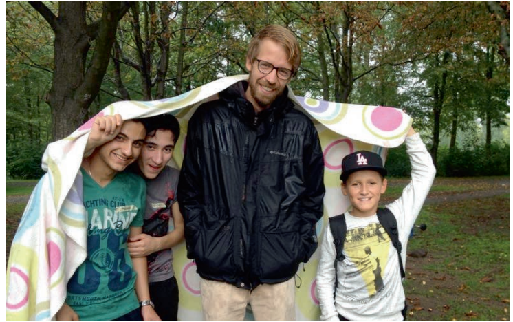
Weitblicker und ihre Paten beim Sommerfest

Das Wetter hat zwar nicht ganz mitgespielt, doch davon haben sich die WeitblickerInnen und ihre