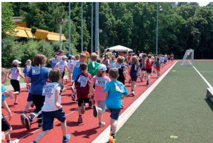
Die kleinen Läufer beim Start im Unistadion

In der Woche darauf fand unser 2. Spendenlauf im Uni Stadion mit tatkräftiger Unterstützung der Tausendfüßlerschule und zahlreichen weiteren Läuferinnen und Läufern statt. Mit respektablen 1071 gelaufenen Kilometern wurden unsere Erwartungen mehr als übertroffen. Unglaubliche 10.000 Euro wurden dabei erlaufen, gesponsert von Eltern, Verwandten, Freunden und anderen UnterstützernInnen der Läufer, die sich für unsere Auslandsprojekte ordentlich ins Zeug gelegt haben.