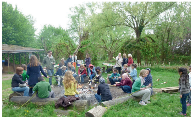
Lagerfeuer und Stockbrot beim Gartenfest

Gefeiert wurde auch im April – mit 15 WeitblickerInnen, ebenso vielen Patenkindern sowie einigen Eltern. Auf dem Gelände der Grünen Spielstadt in Dransdorf wurde Stockbrot am Lagerfeuer gebacken und biologisches Saatgut in kleinen Bechern ausgesät. Kresse und Sonnenblumen durften zum Ziehen mit nach Hause genommen werden. Die Setzlinge wurden im Bildungsgarten gepflanzt. So konnte die