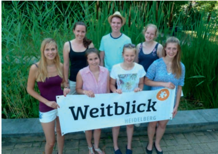
Der neue Heidelberger Weitblick-Vorstand