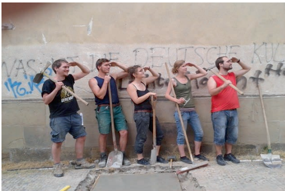
Die glücklichen Bildungs-BaurbeiterInnen vor dem neuen Fundament

Endlich konnten wir das schon seit langem geplante Projekt „Öffentlicher Bücherschrank“ realisieren und dieses Paradebeispiel für gerechten Zugang zu Bildung einweihen. Bei der Eröffnung war gemütliche Wohnzimmeratmosphäre mit Sofas und Musik mitten auf dem Gehweg angesagt.