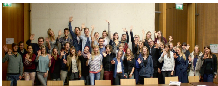
Wir feiern unseren 5. Geburtstag!