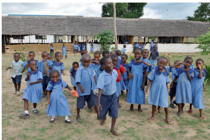
SchülerInnen des St. Joseph House of Hope

Im März haben einige Kölner WeitblickerInnen die Leiterinnen eines Bildungszentrums an der Küste Kenias kennengelernt. Im „St. Joseph House of Hope“ gibt es Kindergärten, Grundschulen, weiterführende Schulen sowie ein Ausbildungszentrum. Wir möchten das Bildungszentrum langfristig unterstützen und fördern. Begonnen haben wir im Sommersemester mit einer Spende für die Ausstattung der Klassenzimmer. Geplant sind außerdem Bücher- und Materialspenden und die Möglichkeit, sich vor Ort im Projekt zu engagieren.