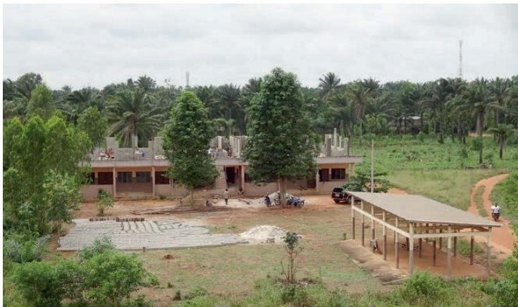
Baustelle des ersten Lehrgebäudes auf dem neuen Campus

Dieses wird einen großen Hörsaal, einen Unterrichtsraum, sowie das Direktorenbüro beinhalten. Parallel dazu wird im November diesen Jahres mit der Errichtung des Sportplatzes auf dem neuen Campus begonnen. All dies ermöglicht es dem INJEPS , die Einschreibung der neuen StudentInnen zum Wintersemester bereits auf dem neuen Campus stattfinden zu lassen und Lehrveranstaltungen im neuen Gebäude abzuhalten. In Münster arbeiten wir unterdessen