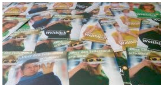
Neue Flyer „Über den Tellerrand schauen“

Zeitgleich zum neuen Corporate Design sind auch unsere neuen Flyer und Dauerposter fertig geworden. Hier zeigt sich: eine geniale Idee und eine professionelle Umsetzung ist alles!