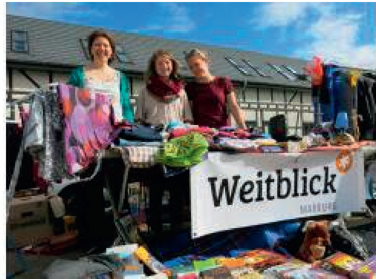
Sommer, Sonne und Spaß beim Flohmarkt!

„Willst du etwas nicht mehr haben, lass' doch andre Spaß dran haben. Wir haben viele tolle Sachen, und wollen sie zu Geld dann machen. Wir von Weitblick Marburg geben alles und noch mehr nach Brasilien zu „AdoleScER“. Dort wo Kinder eine Zukunft finden wollen wir sie in tolle Projekte einbinden. In Kenia wolln wir nen Schulbau unterstützen, das wird vielen Kindern nützen. Auch nach Indien geht ein Drittel, das Community College freut sich über neue Mittel. Am 14. Juni kommt vorbei, auf zum Flohmarkt mit Geschrei. Wir stehn am Schwanhof mitten drin zum weitblick-Banner müsst ihr hin. Mit Freude helfen, Hoffnung schenken, an gerechte Bildungschancen denken.“